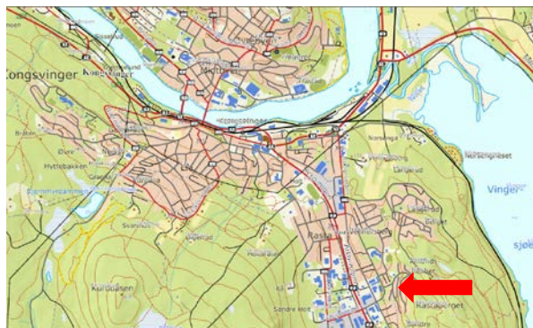
Kongsvinger by med plassering av Uglevegen borettslag

Kartgrunnlag: ©GEOVEKST (GV-K-04xx) og Statens kartverk (MAD12002-HE03/015)